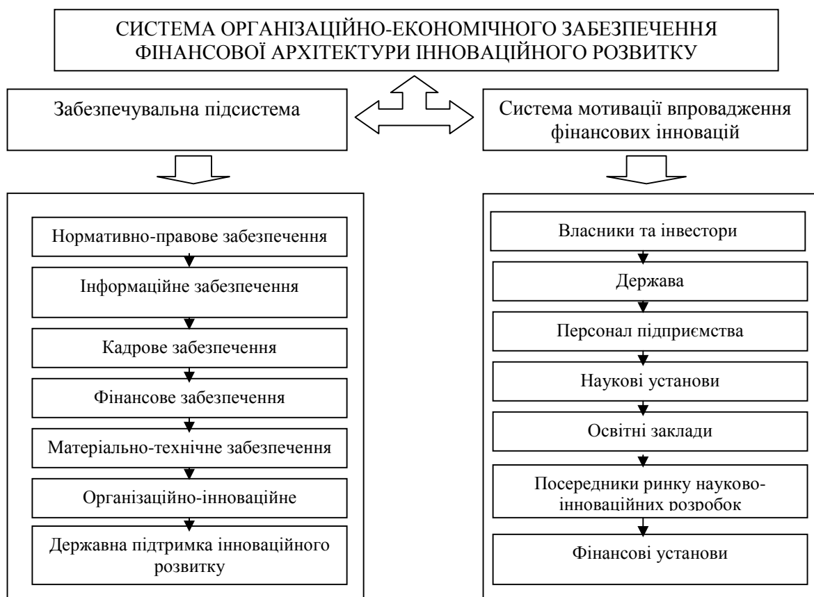
Рис. 2. Система забезпечення інноваційного розвитку молокопереробних підприємств

Чинна система організаційно-правового та економічного забезпечення є органічною частиною зовнішньоекономічного середовища функціонування молокопереробних підприємств регіону, якому притаманні свої специфічні ознаки, риси, умови розвитку продуктивних сил, характер державної підтримки, використання людського капіталу та результатів науково-технічних розробок. Галузева система забезпечення інноваційного розвитку формує механізм взаємодії функціональних блоків, зв'язків та елементів на різних рівнях впровадження інновацій, власні напрями та індикатори розвитку, які свідчать про доцільність переходу на інноваційну модель функціонування та сигналізують про її результативність.