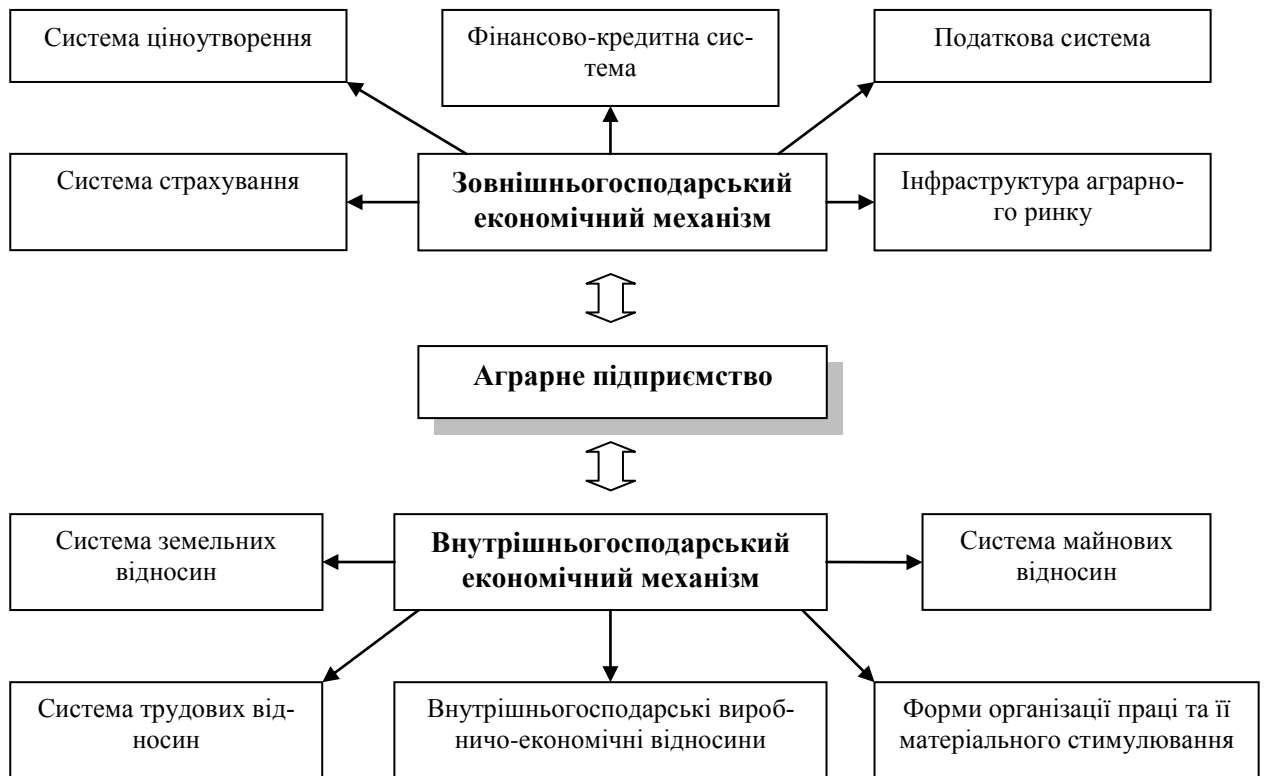
Рис.1 Елементи економічного механізму господарювання

В процесі вивчення особливостей формування і функціонування організаційно-економічного механізму господарювання аграрних підприємств нами було визначено комплекс організаційних чинників, які здійснюють активний вплив на результати господарської діяльності суб'єктів аграрного сектору. Узагальнюючі складові організаційного механізму, їх можна виділити в 3 групи: організаційно-виробничі заходи (визначення оптимальних розмірів організаційно-правових структур ринкового типу, удосконалення їх виробничої структури та виробничого напрямку, відновлення і модернізація ресурсного потенціалу та ін); організаційно-правові заходи (вибір форми господарювання та правова обґрунтованість діяльності, здійснення внутрігосподарських організаційно-структурних перетворень, тощо); організаційно-соціальні заходи (розвиток соціальної інфраструктури села).