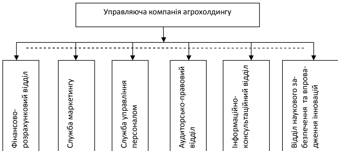
Рисунок 2 - Лінійно-функціональна структура управлінського центру

До функцій служби маркетингу слід віднести маркетингові дослідження, постачання безперебійного процесу виробництва, пошук найбільш вигідних каналів реалізації виробленої і переробленої продукції.