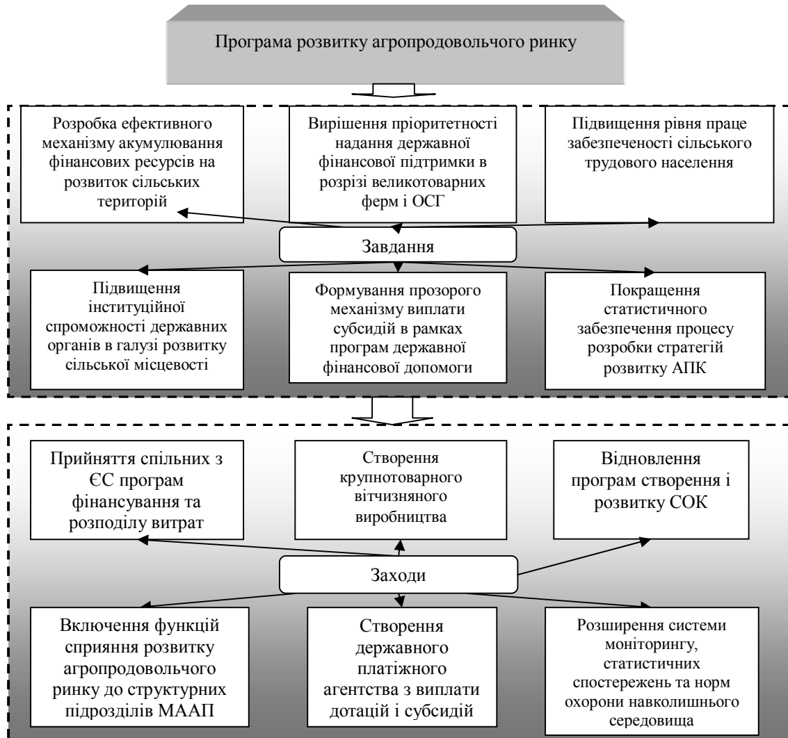
Рис. 2. Програма стратегічного розвитку агропродовольчого ринку

В сучасних умовах активізації інноваційної діяльності суб'єктів ринку сільськогосподарської сировини та готових продуктів харчування стратегія державного стимулювання інноваційних структур може бути реалізована у вигляді таких конкретних важелів і форм: інвестиційний податковий кредит, дослідницький податковий кредит, інвестиційна податкова знижка (рис. 3).