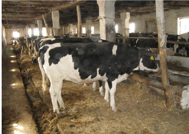
Мал.7. - Нетелі української черно-рябої молочної породи

Годівля нетелей у господарстві організована з урахуванням віку, живої маси, періоду тільності та рівня розвитку тварин. Основним завданням у цей період є забезпечення інтенсивного росту, нормального розвитку плода та підготовки організму нетелей до майбутньої лактації.