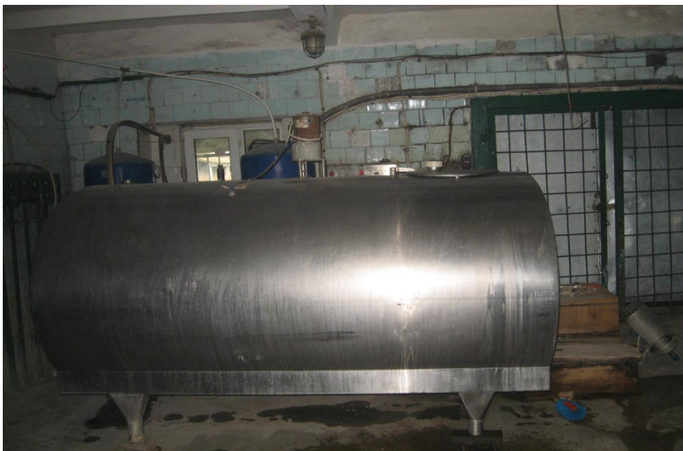
Мал.11 Танк охолоджувач молока закритого типу Orion-milk

Сортність молока визначається відповідно до вимог ДСТУ 3662-97 і залежить від органолептичних, фізико-хімічних та мікробіологічних показників, таких як запах, смак, чистота, кислотність, бактеріальна забрудненість та вміст соматичних клітин. Відповідно до цих показників сире молоко поділяють на вищий, перший та другий сорти.