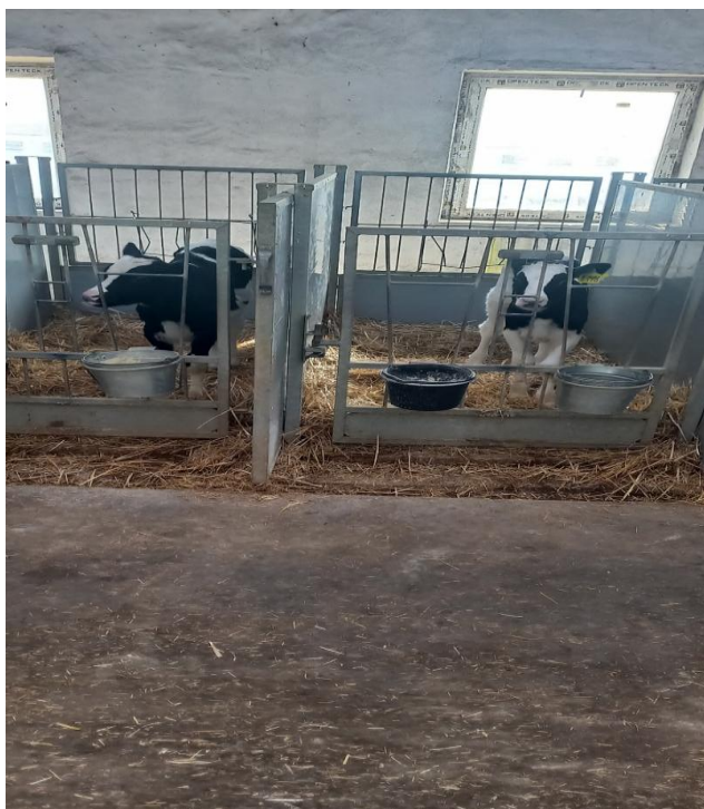
Мал.4. - Індивідуальна клітка для новонароджених телят

Утримання телят в індивідуальних клітках здійснюється на незмінній солом'яній підстилці до 3-місячного віку. Підстилка регулярно підсипається свіжою соломомою для підтримання сухості та належного санітарного стану. У цей період особливу увагу приділяють випоюванню молозива, молока або замінників молока, а також поступовому привчання телят до споживання концентрованих і грубих кормів.