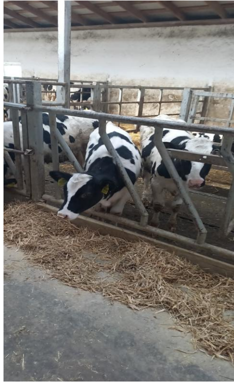
Мал.5 - Телиці з 3 –х місячного віку у груповому станку

Після народження теляти у господарстві його зважують ще до першої годівлі, присвоюють індивідуальний номер та кличку, після чого дані заносять до журналу обліку приплоду. Одним із найважливіших заходів у перші години життя є своєчасне випоювання молозива, оскільки саме воно забезпечує новонароджене теля необхідними поживними речовинами та антитілами, які підвищують захисні властивості організму.