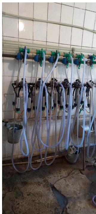
Мал. 10. - Переносні доїльні стакани

Для лінійного доїння корів використовуються у молочному скотарстві для механізованого доїння корів у корівнику переноснідоїльні стакани (мал. 10). До складу установки входять доїльні апарати підвісні частини з доїльними стаканами, які надягаються на дійки корови, молочні шланги прозорі трубки, через які молоко транспортується, вакуумні шланги забезпечують створення вакууму для процесу доїння, колектори та пульсатори регулюють чергування стиснення і розтиснення дійкової гуми, імітуючи природне ссання теляти, вакуумна магістраль трубопровід у верхній частині установки, через який подається вакуум, кріплення для апаратів використовуються для зручного зберігання обладнання після доїння. Дана система забезпечує механізоване доїння корів, що дозволяє підвищити продуктивність праці, зменшити витрати ручної праці, покращити санітарно-гігієнічні умови отримання молока, знизити ризик травмування вимені та забруднення молока. Обладнання експлуатується у прив'язному корівнику. Після завершення доїння апарати підвішуються на спеціальні тримачі та промиваються для дотримання ветеринарно-санітарних вимог.