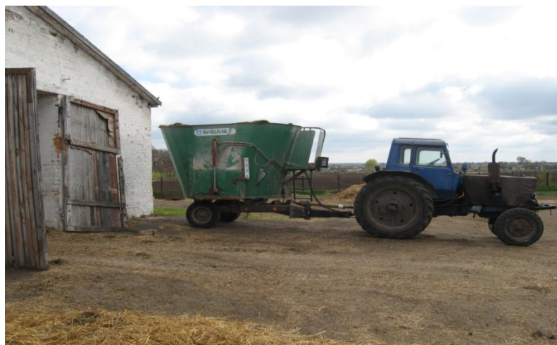
Мал. 9. - Кормозмішувач «Брацлав»

Використання мобільного кормозмішувача дає можливість забезпечити точне дозування компонентів раціону, якісне змішування та рівномірну роздачу кормів, що сприяє підвищенню рівня споживання сухої речовини, зменшенню втрат кормів та покращенню ефективності годівлі. Основним функціональним елементом агрегату є електронний блок управління, який дозволяє не лише здійснювати зважування, а й програмувати раціони.