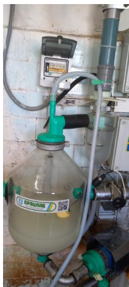
Мал. 9. Молокоприймальна колба доїльної установки з молокопроводом УДМ-100 «Брацлавчанка»

Принцип роботи установки полягає в тому, що після доїння молоко через доїльні апарати надходить у молокоприймальну колбу (мал. 10), проходить фільтрацію та за допомогою насоса транспортується молокопроводом до резервуара для охолодження і зберігання. Використання такого обладнання дозволяє забезпечити високу санітарну якість молока, зменшити контакт молока з навколишнім середовищем, автоматизувати процес обліку надоїв, підвищити продуктивність праці операторів машинного доїння. Дане обладнання є важливою складовою сучасної технології виробництва молока у господарстві.