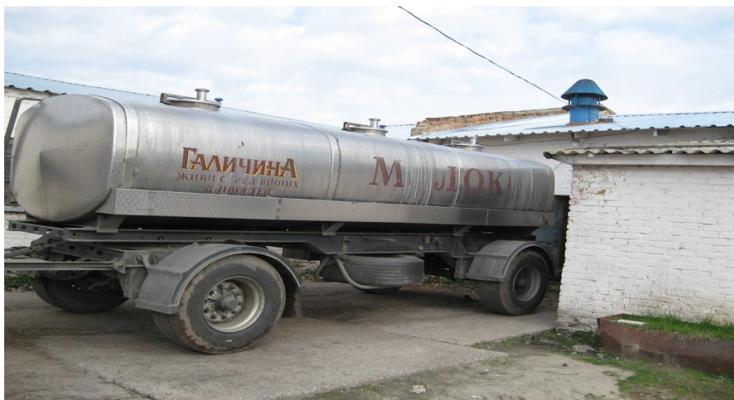
Мал.12. - Автоцистерна для транспортування молока

Категорично забороняється перевозити молоко разом із сильно пахучими, отруйними або пилоутворюючими речовинами (наприклад, бензин, газ, дьоготь, отрутохімікати, цемент, крейда тощо), а також використовувати молочні цистерни для інших вантажів. Перед відправленням цистерни обов'язково пломбують, що гарантує безпеку та збереження якості продукції під час транспортування.