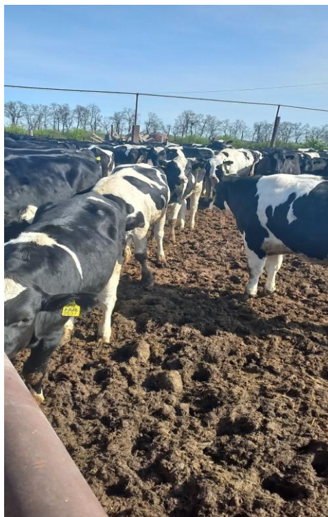
Мал.6. - Ремонтні телиці вік (10-12 міс.) на вигульному майданчику

У літній період телиць забезпечують зеленою масою та, організують утримання на вигульних майданчиках (мал.6.), що позитивно впливає на розвиток молодняку та зміцнення здоров'я тварин. У зимовий період основними кормами є сіно, сінаж, силос та концентровані корми.