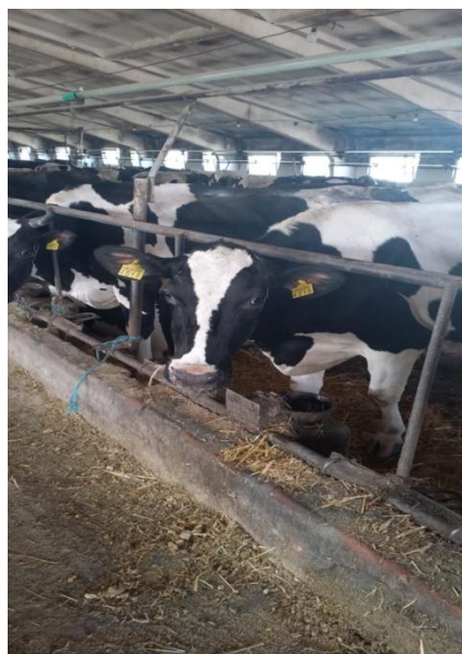
Корови господарства українсько чорно-рябої молочної породи

Отже, результати аналізу показують, що в господарстві спостерігається скорочення загального поголів'я великої рогатої худоби, однак при цьому підтримується відносно стабільна чисельність корів та здійснюється робота з відновлення стада за рахунок збільшення кількості нетелей.