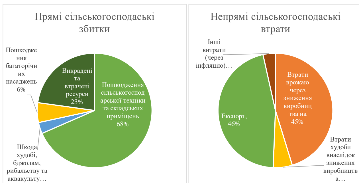
Рис. 1. Прямі та непрямі збитки сільського господарства станом на 2023 рік

Шкоду, яку нанесла агробізнесу України та країні в цілому війна, - важко переоцінити. Для агросфери це колосальні втрати, які вимірюються у десятках мільярдів доларів США. Прямі збитки сільського господарства України станом 2023 рік склали 8,7 млрд дол, а непрямі – 31,5 млрд дол (рис. 1).