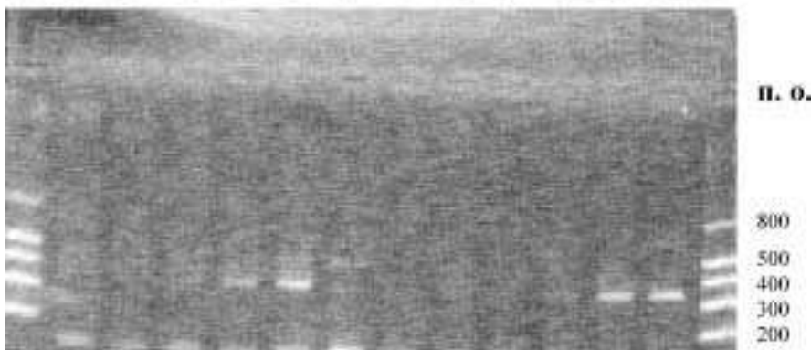
Рис. 2. Електрофорез продуктів ЗТ-ПЛР в агарозному гелі: 1-3 — T_{\text{від}} = 52\text{ }^{\circ}\text{C} ; 4-6 T_{\text{від}} = 56\text{ }^{\circ}\text{C} ; 7-9 — T_{\text{від}} = 58\text{ }^{\circ}\text{C} ; 10-12 — T_{\text{від}} = 60\text{ }^{\circ}\text{C} ; М — маркери молекулярної ваги

Крім того, встановлювали оптимальну концентрацію \text{Mg}^{++} у реакційній суміші. З метою отримання великої кількості ампліконів та уникнення неспецифічних продуктів ампліфікації випробували наступні концентрації: 1,0 мМ, 1,2 мМ та 1,5 мМ (рис. 3).