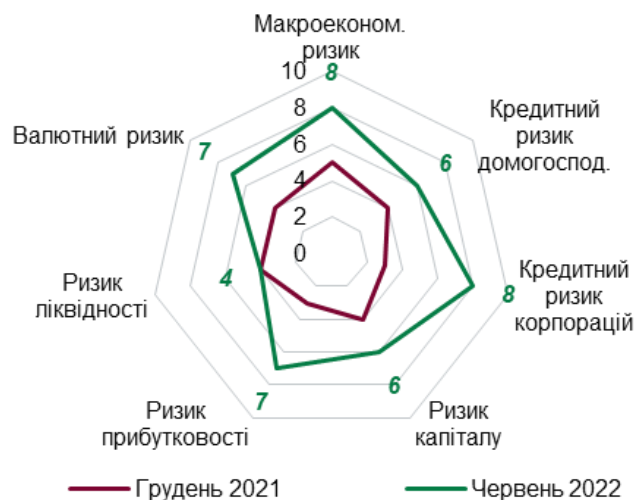
Рис. 2. Структура ризиків грошового ринку України у воєнний період * побудовано на основі офіційних даних Національного банку України

Оцінюючи ризики грошового ринку України у воєнний період було встановлено: через глибокий спад економіки та зростання дефіциту бюджету макроекономічний ризик зріс (+3); банки очікують значне погіршення якості портфеля, адже частка прострочених кредитів зросла, що призвело до зростання (+2) кредитного ризику домогосподарств та кредитного ризику підприємств (+5) через суттєве зростання очікуваних кредитних збитків і погіршення якості відповідного кредитного портфеля; також зріс ризик капіталу (+2); на сьогодні достатність капіталу значно вища за встановлені мінімальні вимоги, однак надалі