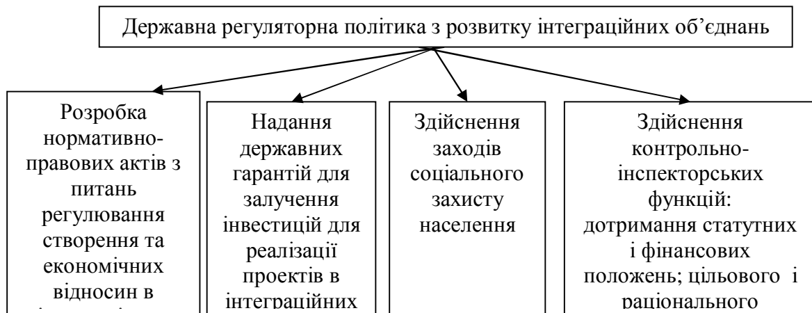
Рис. 2 Заходи державного регулювання з розвитку інтеграційних об'єднань в аграрній сфері

проявів недобросовісної конкуренції, регіональної монополізації ринку, притиснення прав сільськогосподарських виробників і інтересів споживачів повинен здійснюватись контроль за дотриманням інтегрованими формуваннями антимонопольного законодавства, статутних і фінансових положень, цільового використання земель сільськогосподарського призначення, екологічних вимог і ін.