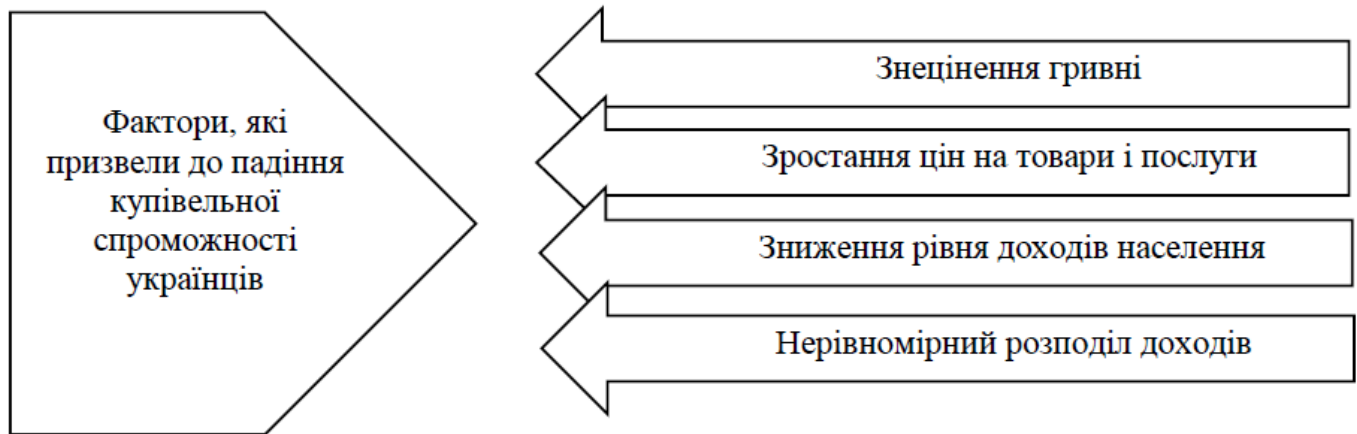
Рис. 2 Фактори, які призвели до падіння купівельної спроможності українців [3].

Основні фактори, які призвели до падіння купівельної спроможності українців визначені на рис. 2.