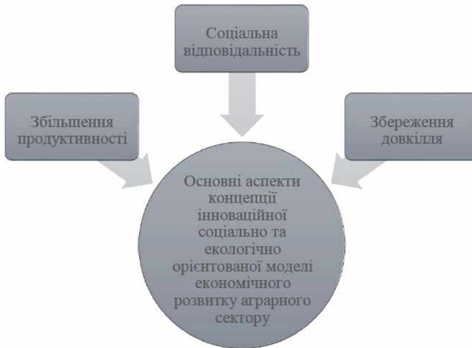
Рис. 1 Основні аспекти концепції інноваційної соціально та екологічно орієнтованої моделі економічного розвитку аграрного сектору