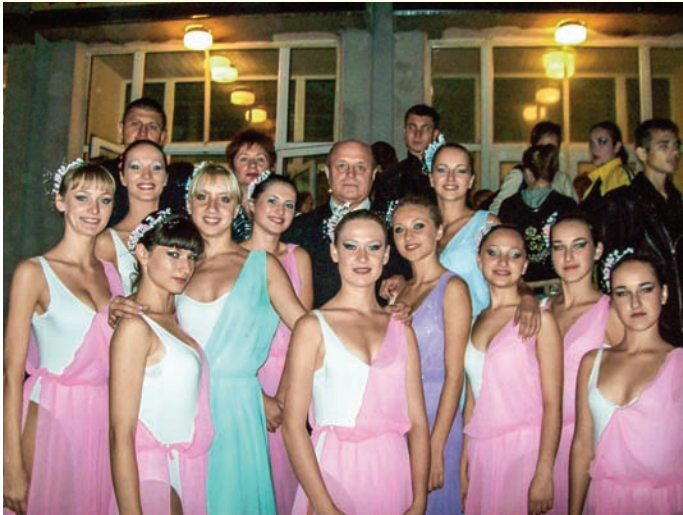
Танцювальний колектив «Анлер» бере участь у заключному етапі Всеукраїнського фестивалю художньої творчості «Софійські зорі», м. Умань

— консультаційна підтримка та впровадження специфікацій комбікормів для різних статево-вікових груп свиней з урахуванням потреб породи «П'єтрен» як ультрам'ясного генотипу.