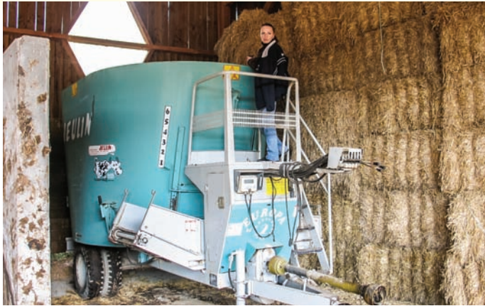
Практика на фермі з розведення м'ясної худоби породи «Шароле» на базі регіонального центру «Масон», Франція