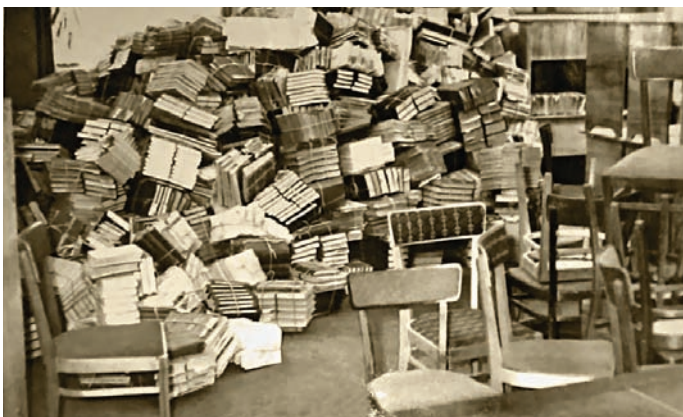
Післявоєнний стан книгосховища інституту