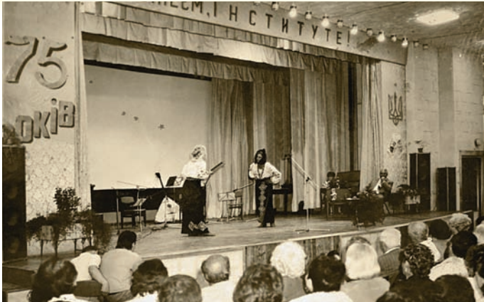
Святкування 75-річного ювілею інституту