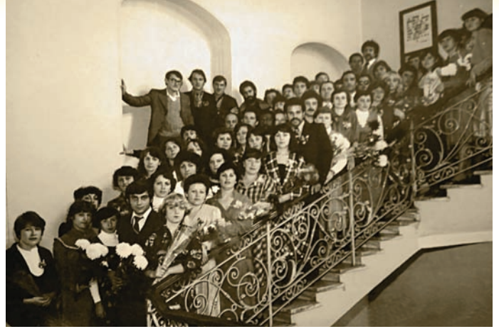
Останній дзвоник, 1982 р.

Вагомий внесок у розвиток інституту в післявоєнні роки зробили люди, які забезпечували належне