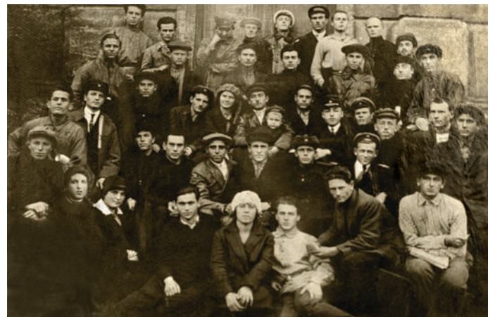
Група студентів III курсу меліоративного факультету, 1928 р.

Із початку існування основною метою своєї діяльності секція визначила вирішення питання про «Виробничі типи сільського господарства Степу України та шляхи його соціалістичного будівництва». Згідно з цим завданням, за згодою з окремими округами України та їх