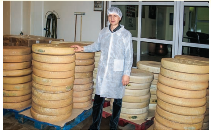
Вивчення технологій Асоціації виробництва сирів «Comte» в м. Поліньї, Франція

елементів (кобальт, молібден, свинець, цинк, хром, мідь, залізо, марганець, нікель, кадмій, миш'як, ртуть), що знаходяться у пробах. Визначається активність радіонуклідів у продуктах харчування, біологічних пробах та інших об'єктах навколишнього середовища, а також моніторинг вмісту лікарських і наркотичних засобів.