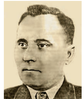
Декан агрономічного факультету Г. Є. Гришко

Знаючу людиною є ще один випускник інституту — Г. Є. Гришко. У 1934 р. він починав свою діяльність в ОСГП як аспірант, в. о. доцента кафедри механізації. Згодом був завідувачем навчальної частини, деканом агрономічного факультету. З 1939 р. Г. Є. Гришко — на високих партійних і державних посадах у Західній Україні. Під час війни Григорій Єлісейович обіймав найвищі військові політичні посади у складі Донецького, Центрального, 1-го і 2-го Білоруських фронтів, що нищили німецько-фашистські війська. Нагороджений багатьма державними і військовими, в тому числі іноземними нагородами. Йому присвоєно військове звання генерал-майора (1945). Після війни працював на високих партійних та державних посадах в Україні.