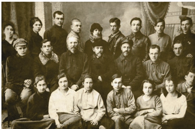
Фахівці-зоотехніки, які навчалися на відділі тваринництва, 1924 р.