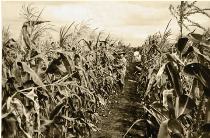
Студенти на практиці в навчгоспі «Червоний хутір»

школою, секретарем декана та факультетської комісії став молодший викладач, і з цього часу формальні справи навчально-наукового життя повністю перейшли до педагогічного персоналу. Треба зазначити, що це не позбавило права студентства на участь та управління навчальним життям, але внесло порядок у формальну роботу, яку було передано постійному колективу з певним досвідом.