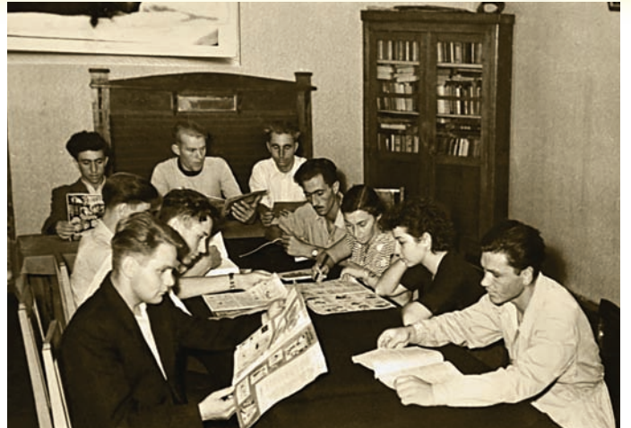
У читальній залі бібліотеки ОСГІ

«Неорганізованість господарств, які були в основному дрібновласницькими з низькою продуктивністю ручної праці, пішла в минуле. На зміну їм прийшли МТС, радгоспи і колгоспи, які добились успішної механізації найбільш трудомістких процесів і показали небачені досі приклади високої продуктивності праці. Зріс культурний і технічний рівень знань наших колгоспників і робітників радгоспів. У цьому процесі брав посильну участь і колектив Одеського сільськогосподарського інституту». — так оцінював зусилля ОСГІ його директор А. Л. Лозицький у 1939 р.