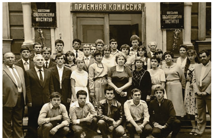
Посвята в студенти, 1984 р.