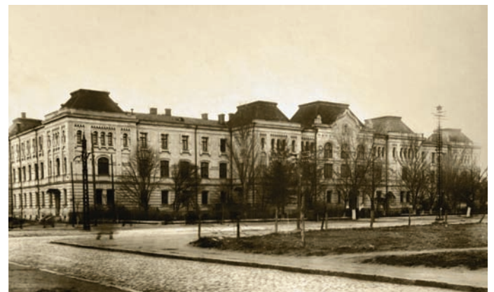
Навчальний корпус інституту, 50-ті рр. XX ст.

Важливе значення для відновлення сільського господарства Одещини і сусідніх областей мали організовані при інституті курси з перепідготовки голів колгоспів,