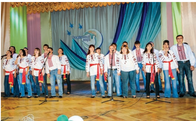
Хорова студія університету

Завдяки наявному обладнанню проводяться дослідження якості основних м'ясних і молочних продуктів. Здійснюється послідовний багатоелементний аналіз