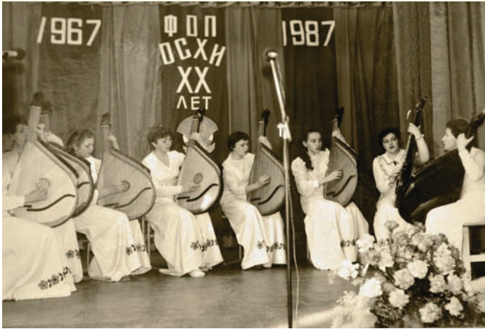
Ансамбль бандуристок, 1987 р.