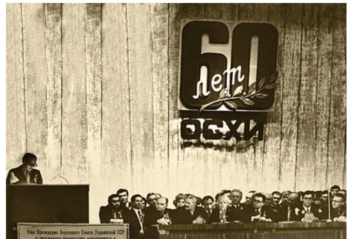
Офіційні урочистості з нагоди 60-річчя інституту