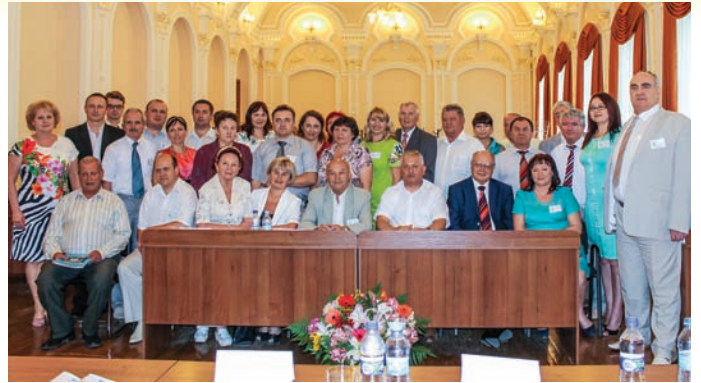
VI міжнародної науково-практичної конференції «Браславські читання», 2015 р.

сільськогосподарських машин і обладнання в господарствах різних форм власності; – вдосконалення племінної роботи у тваринництві; – покращення наявних і розроблення нових методів ранньої діагностики, профілактики й лікування незаразних, інфекційних та інвазійних хвороб сільськогосподарських тварин; Дослідження в університеті проводили згідно з тематичним планом науково-дослідної роботи.