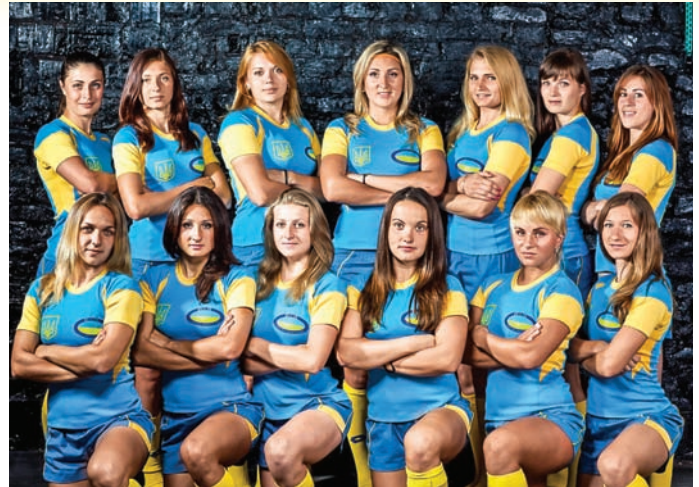
Національна збірна України з регбі-7: студентки економічного факультету ОДАУ – чемпіонки Європи дивізіону «Трофі», 2014 р.

На всеукраїнських спортивних іграх серед студентів аграрних вищих навчальних закладів України збірна