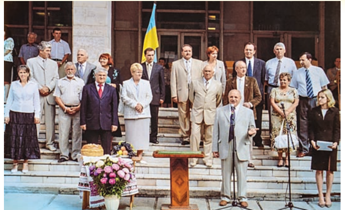
День знань в університеті

До структури університету входить навчально-виробнича ветеринарна клініка, відділення післядипломної освіти, відділ підвищення кваліфікації та сприяння працевлаштуванню випускників, підготовче відділення, відділ по роботі з іноземними громадянами, навчально-науково-виробничий комплекс (ННВК), центри практичної підготовки (філії кафедр), навчальні лабораторії, аспірантура, науково-дослідні лабораторії, фундаментальна бібліотека, музей, інформаційно-редакційний відділ, культурний центр, студентський оздоровчий табір «Лукомор'я».