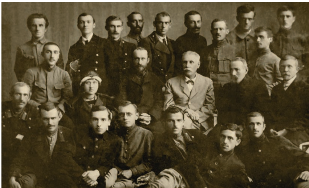
Перший випуск ОСГІ, 1921 р.

П'ятиріччя Одеського сільськогосподарського інституту стало знаковим у його історії. В жовтні 1923 р., згідно з Рішенням Одеського губвиконкому, в постійне користування інституту було передано будівлю за адресою вул. Канатна (Свердлова), 99 — приміщення колишньої Одеської духовної семінарії, загальною площею понад 12 тис. м 2 . Будівлю споруджував у 1902–1903 рр. архітектор Л. Ф. Прокопович. У післяреволюційний