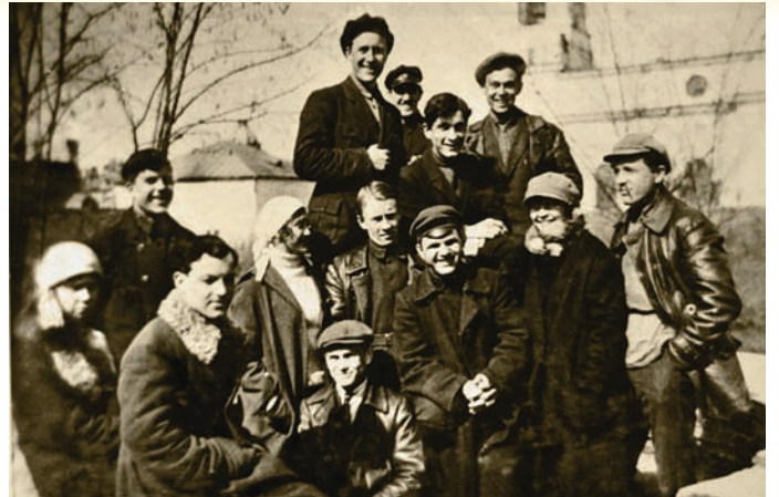
Студенти ОСГУ, 1926 р.