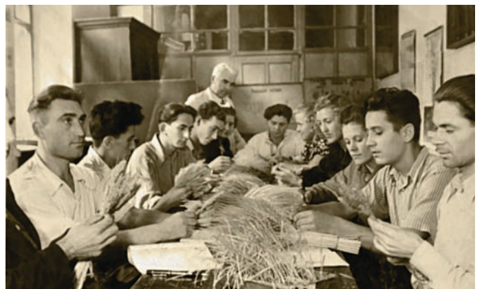
Лабораторне заняття з «Рослинництва»

«Ветеринарію» протягом першого десятиріччя інституту викладали епізодично, при незначній кількості