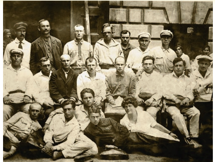
Губвідділ профспілки «Всероботземлі»

Масловський (Київська область) інститут насінництва та селекції.