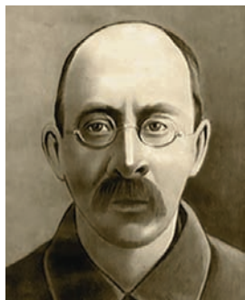
Професор О. І. Набоких

У створенні, фундації та розвитку інституту в перше десятиріччя вагому роль відіграли видатні вчені свого часу: професори О. І. Набоких, І. Я. Точидловський (перший директор), Г. І. Танфільєв, А. О. Сапегін (майбутній віце-президент АН України), Г. А. Боровиков, О. О. Браунер, А. А. Бориневич, О. О. Бичихін, А. І. Погибок, Л. А. Єгунов та ін. Офіційна дата заснування ВНЗ — січень 1918 р. Відкриття відбулося у приміщенні Новоросійського (Одеського) університету на вул. Дворянській, 2.