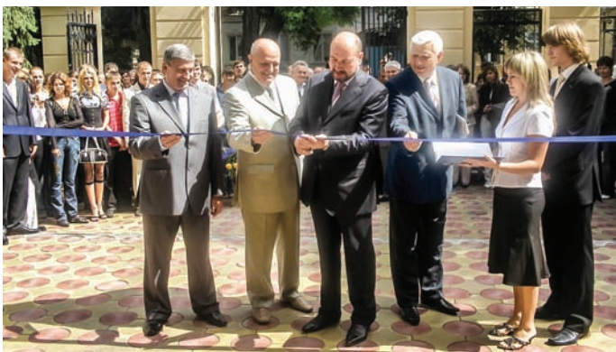
Урочисте відкриття 1 вересня 2007 р. навчального корпусу № 2 (вул. Пантелеймонівська, 13)