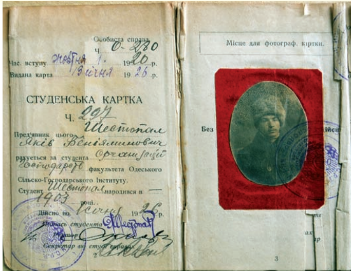
Студентський квиток, 20-ті рр. ХХ ст.

матеріальною допомогою, розроблялася перша частина колективної праці секції на тему «Сільськогосподарське районування Степової України». За одиницю районування було взято адмінрайон. Частина складала другий том і містила індивідуальні наукові роботи членів секції, що обговорювалися на її засіданнях. Перший том знаходився у стадії друкування.