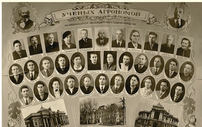
Випуск агрономів, 1962 р.