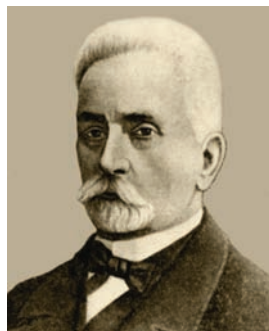
Професор Г. І. Танфільєв