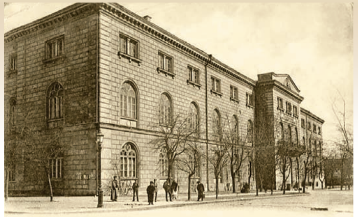
Приміщення Новоросійського (Одеського) університету на вул. Дворянській, 2

Відбулося перше засідання Ради інституту, на якому було затверджено навчальний план чотирирічного