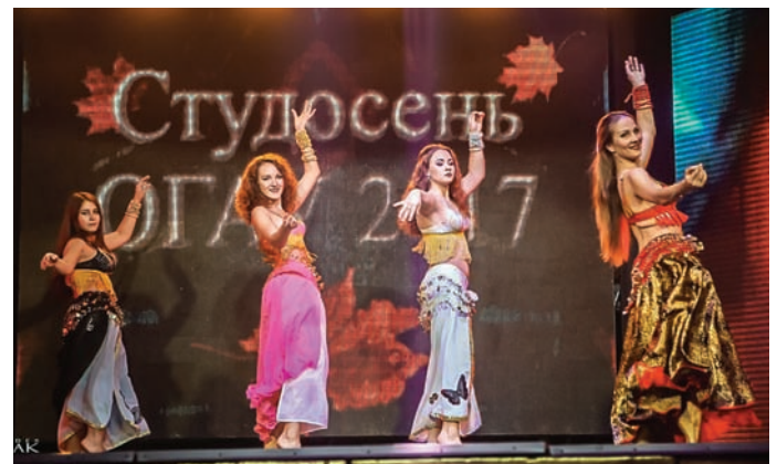
Фестиваль «Студентська осінь — 2017»