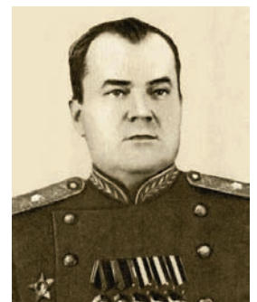
Генерал-майор І. С. Колесніченко

Випускник робітфаку ОСГП (1932) І. С. Колесніченко, після закінчення Харківської школи льотчиків та Вищих військово-політичних курсів, під час Другої Світової війни пройшов бойовий шлях від Дону до Берліну і Праги. Після Перемоги в 1945 р., був призначений на посаду начальника Радянської військової Адміністрації землі Тюрингія (Німеччина), де працював до 1950 р. Нагороджений багатьма державними й бойовими нагородами СРСР та іноземних держав.