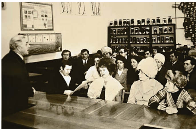
Зустріч випускників у стінах ОСТІ

У розвитку громадянської позиції, гуманітарних якостей і вихованні студентів вагомою була участь