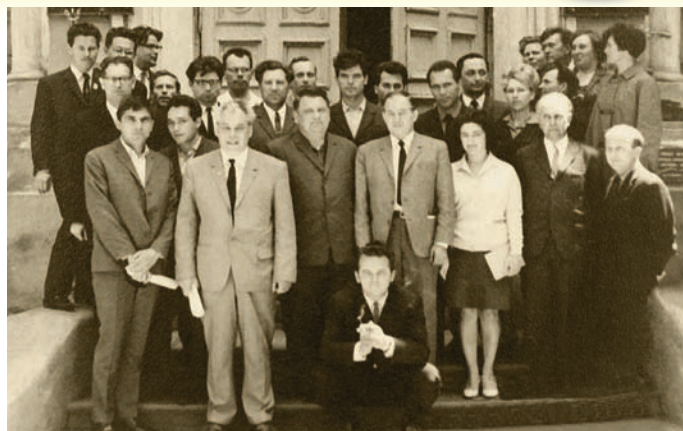
Всесоюзна наукова конференція в Одесі, 1969 р.

багато з яких уперше стали на чолі великих господарств. Курси дали їм практичні й теоретичні знання.