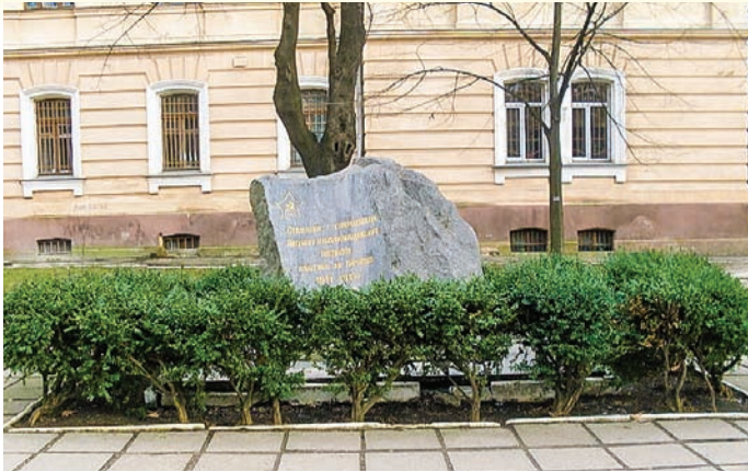
Пам'ятний знак на честь загиблих працівників ОДАУ в роки Другої світової війни