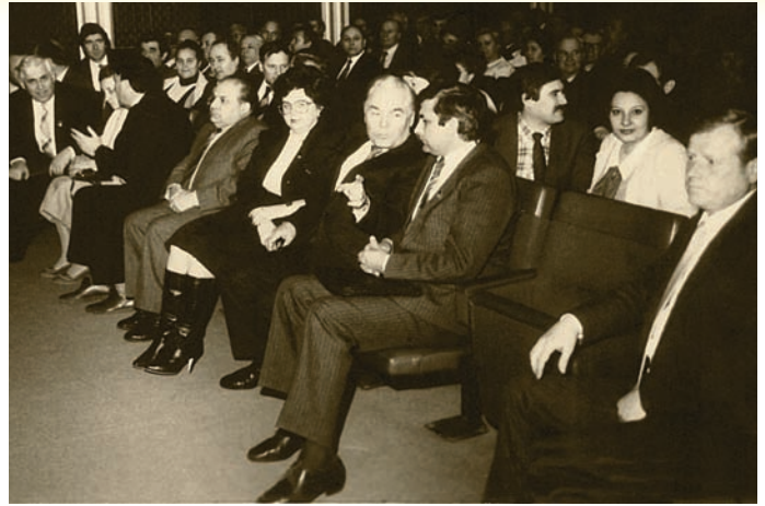
Відзначення 70-літнього ювілею з дня заснування ОСГІ, 1988 р.