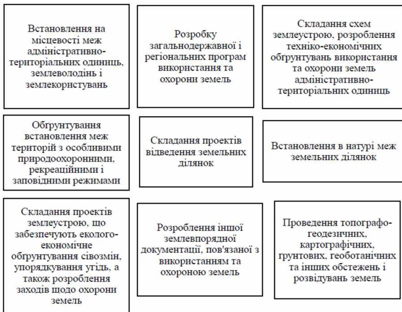
Рис. 3. Зміст землеустрою

Але, на сьогоднішній день відносини людей із землею мають здебільшого тільки споживчий характер, цим самим виснажуючи її. Земля відноситься до невідновних природних ресурсів. Зважаючи на це, важливо сприяти її відновленню за допомогою раціонального та організованого використання або розподілу земельних ділянок. Землеустрій надає можливості покращити розвиток землеробства, раціонально організовуючи функціонування підприємств, земельних ділянок, їх перерозподіл та ефективність користування землею, зберігаючи земельні ресурси.