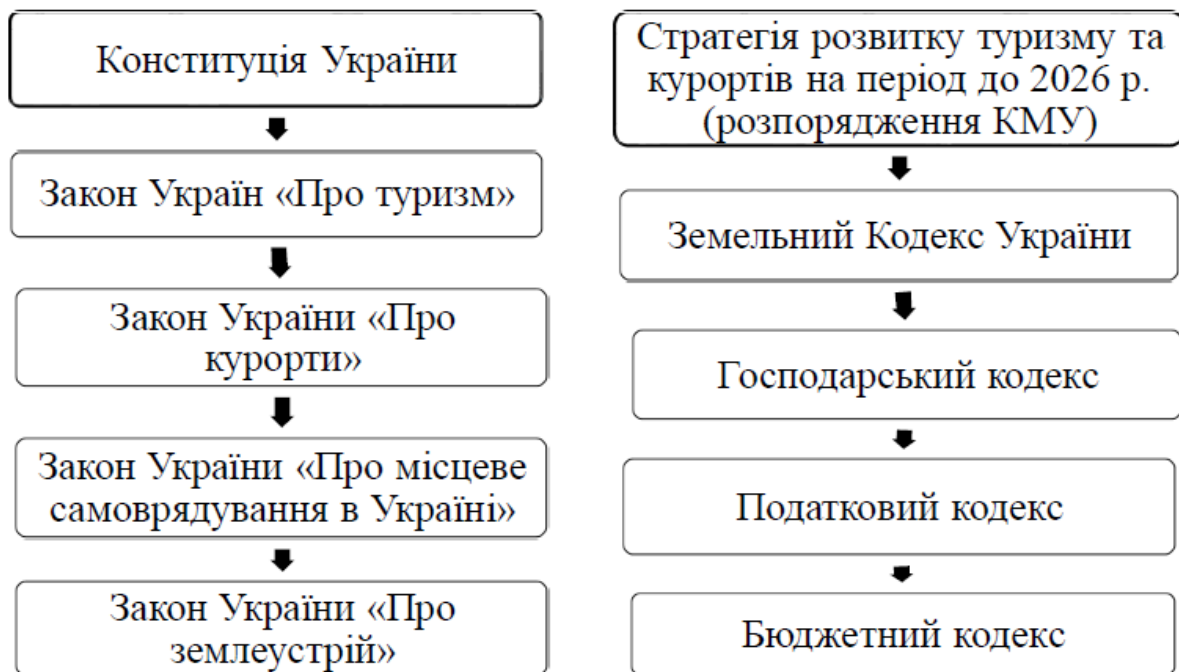
Рис. 1. Нормативно-правова база в сфері рекреації та туризму ОТГ

Нормативно-правове підґрунтя рекреаційно-туристичної галузі об'єднаних територіальних громад включає такі основні правові акти, які приведені на рис. 1.