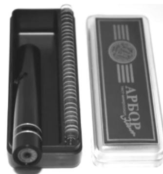
Рис. 1. Тест-мікроскоп "Арбор Еліт"

З метою визначення оптимального часу осіменіння у сук використовували тест-мікроскоп "Арбор Еліт", який складається з власне міні-мікроскопа та набору предметних скелець (рис. 1).