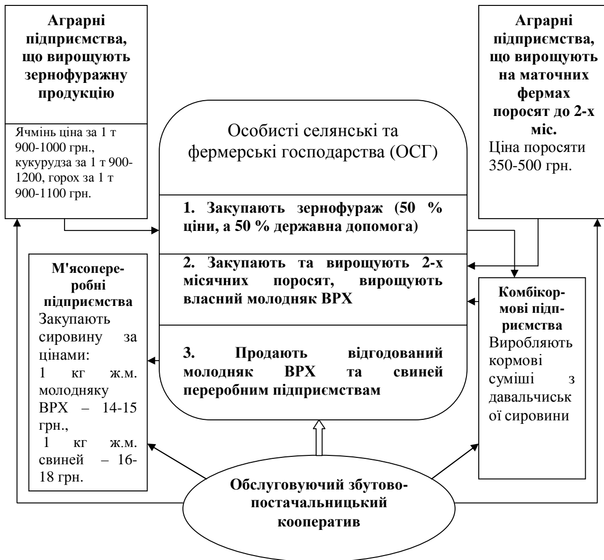
Рис. 2 Модель виробничо-економічних відносин суб'єктів АПК на виробництві зернофуражу, вирощуванні поросят, відгодівлі молодняку ВРХ і свиней, їх реалізація переробним підприємствам

Послуги в кооперативі надаються за собівартістю, фактичний рівень якої може бути визначений в кінці фінансового року.