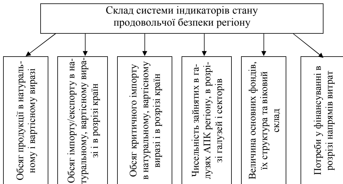
Рис 2. Система індикаторів стану продовольчої безпеки регіону

тивної бази, тобто моніторинг є підставою для перегляду і переробки норм і стандартів. Вимогу дотримання стандартів і норм припускається наявність служби моніторингу, тобто уповноваженого органу, що відповідає за збір інформації, її зберігання, виявлення відхилень та проведення економічного аналізу показників.