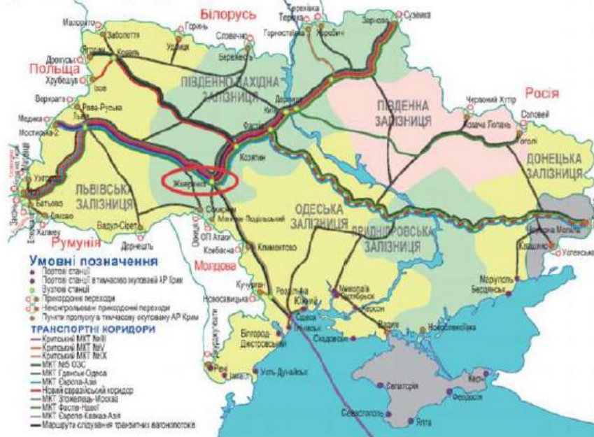
Рис. 1. Місце розташування м. Жмеринки на території України

Жмеринка – місто обласного значення в системі адміністративного устрою Вінницької області. Жмеринка розташована у південно-східній частині Подільської верховини за 49 км від обласного центру. Місто, зокрема, лежить на перетині залізничних коридорів: Критський №3, Критський №5 та Критський №9, Балтійське море – Чорне море.