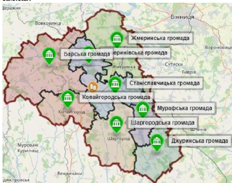
Рис. 2. Склад Жмеринської об'єднаної територіальної громади

До складу Жмеринської об'єднаної територіальної громади входить 13 рад: Жмеринська, Браїлівська, Біликовецька, Дубівська, Жуковецька, Кармалюківська, Коростівецька, Куриловецька, Леляцька, Лисогірська, Людавська, Почапинецька та Рівська. Чисельність населення Жмеринської територіальної громади : 163678. Площа території Жмеринського ОТГ становить: 3136.3 км.кв.