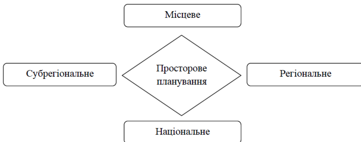
Рис. 1. Рівні просторового планування

Виходячи з рисунку 1, нами було розглянуто нинішній стан планування на кожному з чотирьох адміністративних рівнів.