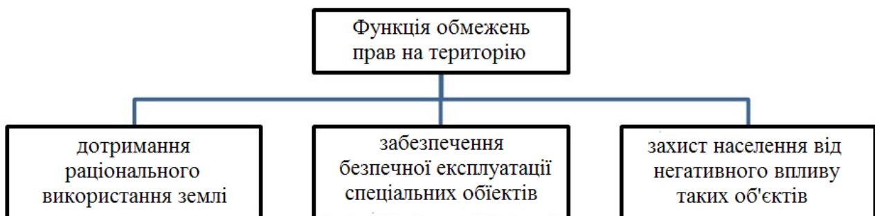
Рис. 3 Функції обмеження прав на землю

Науковець Д. В. Бусуйок вважає, що обмеження прав на землю виконують конкретні функції, які встановлюються в межах зон з особливими умовами землекористування, ми їх представили на рисунку 3.