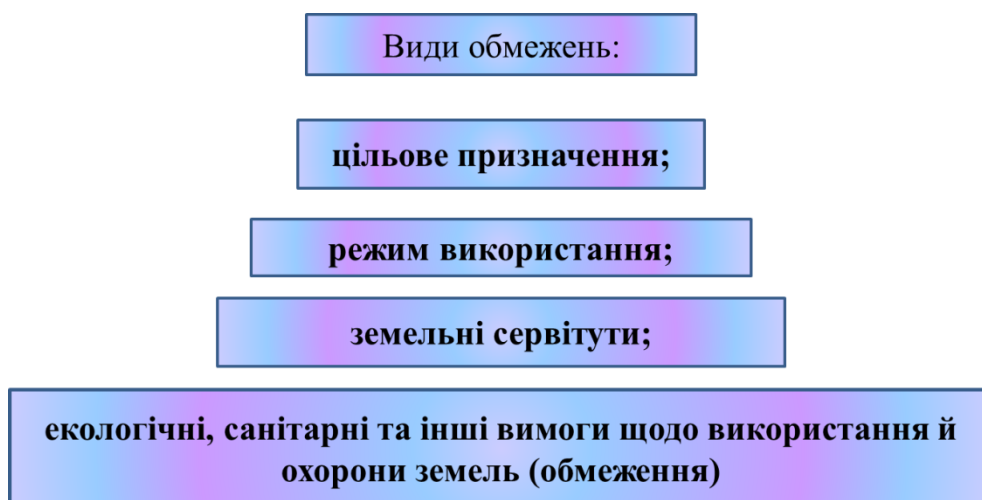
Рис. 1 Види обмежень при використанні земель

Найважливішим інститутом земельно-правової системи є право власності, що регулює земельні відносини, специфіка яких полягає в наявності великої кількості обмежень прав власників землі й користувачів земельної ділянки. Законодавством нашої країни передбачені наступні види обмежень (рис.1): цільове призначення; режим використання; земельні сервітути; екологічні, санітарні та інші вимоги щодо використання й охорони земель (обмеження) [1].