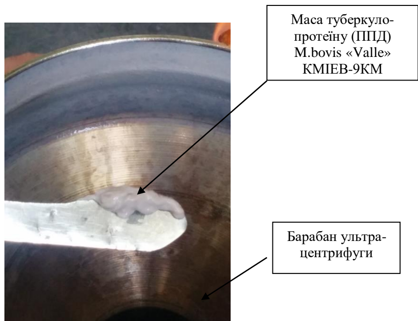
Рис. 4. Зняття туберкуліну зі стінок барабану ультрацентрифуги (високообертового виробничого сепаратору) після осадження його з культурального фільтрату мікобактерій виробничого штаму M. Bovis «Valle» КМІЕВ – 9 КМ ТХО.

При дослідженні великої рогатої худоби в Україні використовують очищений ППД туберкулін для ссавців, діагностична доза якого становить 5000 М.Е. в 0,1 см 3 стандартного розчину. Дослід використання у тваринницьких господарствах України такої дози туберкуліну свідчить про її доцільність та ефективність [1, 2 – 7].