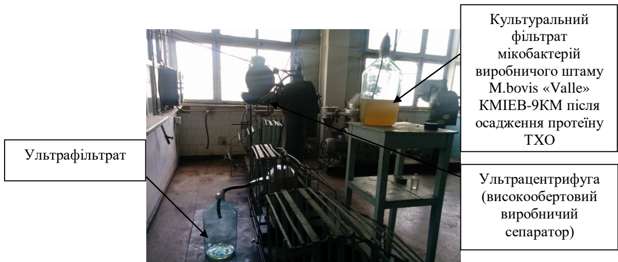
Рис. 3. Процес ультрафільтрації культурального фільтрату мікобактерій виробничого штаму M. bovis «Valle» КМІЕВ-9КМ після осадження протеїну трихлороцтовою кислотою.