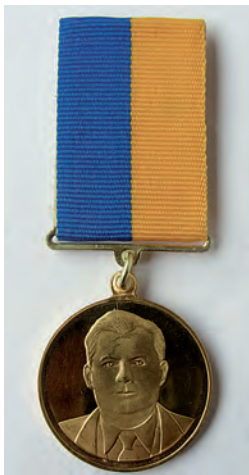
Зовнішній вигляд відзнаки

Українське товариство геодезії і картографії