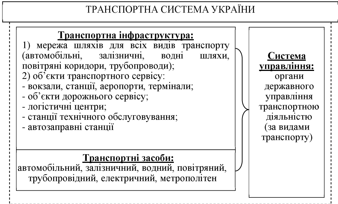
Рис. 1. Структура транспортної системи України

розвиток транспортної галузі та глобальні інвестиційні проекти; безпечний для суспільства, екологічно чистий та енергоефективний транспорт; безперешкодна мобільність та міжрегіональна інтеграція [3].