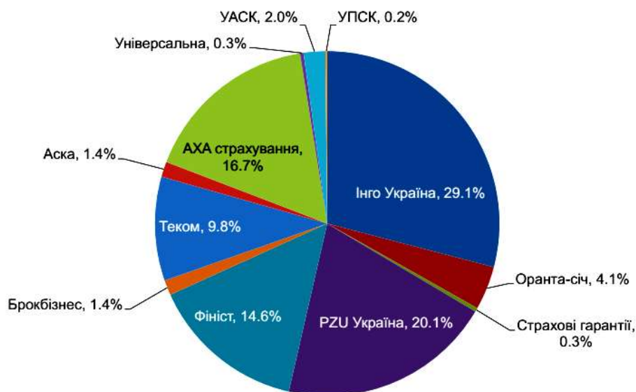
Рис. 1. Відсоток застрахованої площі за страховими компаніями у 2015 р.

На страховому ринку України найбільший відсоток застрахованої площі у 2015 р. мали такі страхові компанії як Інго Україна, РЗУ Україна та АХА страхування (рис. 1).