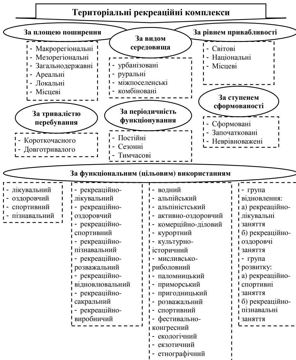
Рис. 2. Типізація рекреаційних комплексів, складено на підставі [5; 7; 11]

Таке зонування територій сприятиме формуванню якісно нової стратегії економічного, соціального та екологічного розвитку рекреаційних територій. І в першу чергу, аспекти зонування повинні бути відображені у методиках та порядку оцінки відповідних земель. Розглядаючи економічну складову розвитку територій, варто зауважити, що земельні ресурси є джерелом наповнення державних бюджетів як ресурс, за який справляється плата за користування та податок, що вимагає досконалого механізму диференціації.