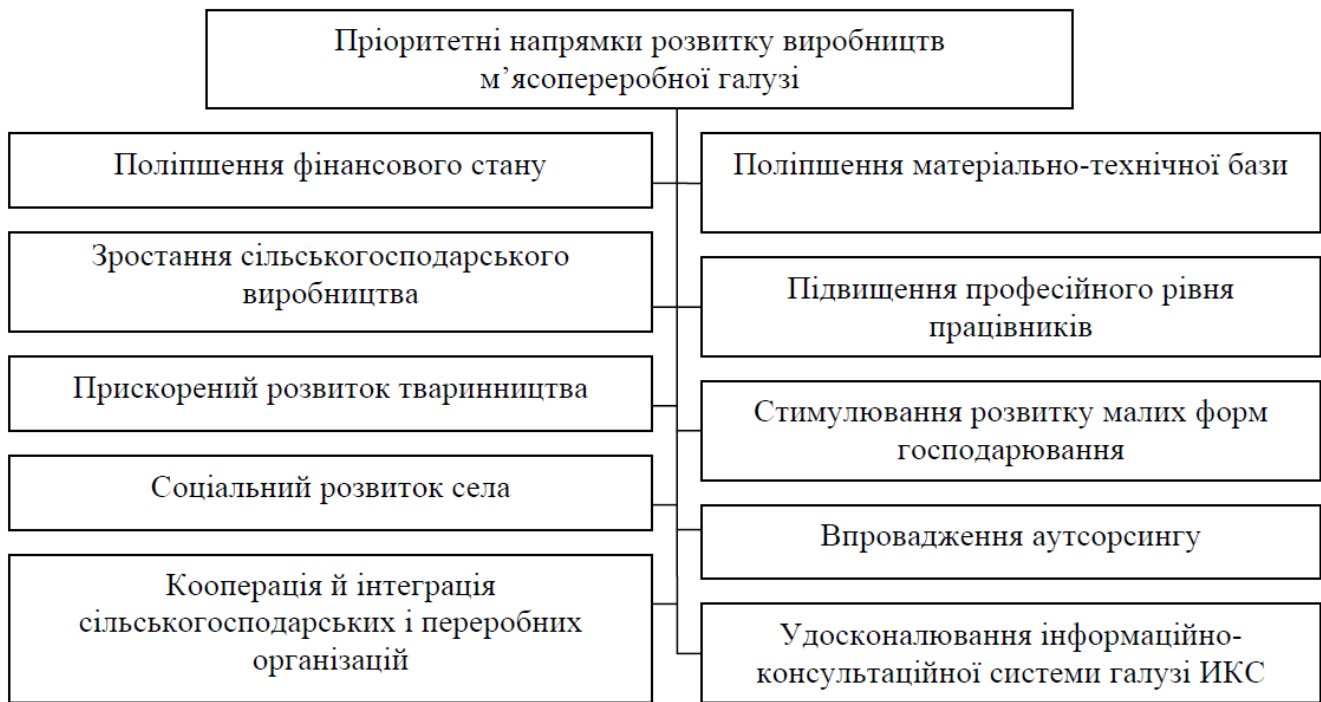
Рис. 1. Пріоритетні напрямки розвитку суб'єктів аграрного виробництва

Ми приєднуємося до думки багатьох дослідників [4-8], що варто розрізняти підходи до процесу стійкого розвитку підприємництва в країнах з розвинутою системою ринкових інститутів і в країнах, що розвиваються. У закордонних країнах стан стійкого розвитку пов'язаний із внутрішніми перевагами фірми, в Україні й інших країнах, де ринкові інститути ще формуються – із зовнішнім підприємницьким середовищем. Критичний аналіз економічних і правових умов розвитку українського підприємництва дає можливість визначити проблеми, що стримують стійкий розвиток підприємницьких організацій. Одна частина проблем носить економічний характер (добробут територій, оподаткування, доступність фінансових послуг для підприємницьких організацій, знос основних виробничих фондів, рівень інфляції). Основна ж частина проблем носить яскраво виражений інституціональний характер (відсутність державної системної політики відносно підприємництва й міжвідомчої координації на державному рівні, законодавче забезпечення діяльності суб'єктів підприємництва, проблема адміністративних бар'єрів, надлишкове регулювання підприємницької діяльності, порушення антимонопольного законодавства й спроби законодавчого переділу галузевих ринків, ріст корупційних витрат).